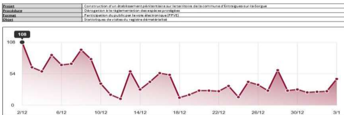
Source : https://www.registre-dematerialise.fr/2786/outil/synthese (données consultables par le garant)

Au regard du nombre de visiteurs sur le site, le nombre d'observations peut apparaître dérisoire ; cependant, elles comprennent deux contributions conséquentes d'associations (FNE 84 et collectif de la ZAD du Plan). A souligner que toutes les observations déposées ne relèvent pas du sujet sur les espèces protégées ; elles expriment pour 6 d'entre elles leur désaccord quant à l'implantation du centre pénitentiaire sur ce site.